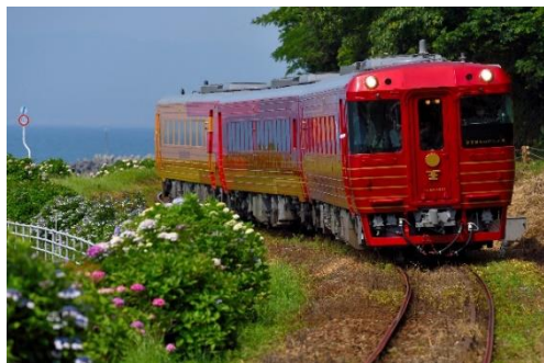
観光列車「伊予灘ものがたり」