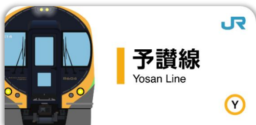
予讃線スタンプ帳ラベル