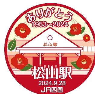
「ありがとう松山駅」スタンプ