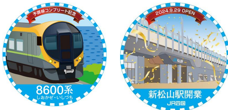
左から22駅達成でもらえる「8600系」スタンプ、「新松山駅開業」スタンプ

今後も、多くのお客さまに鉄道でのお出かけを楽しんでいただけるよう、鉄道事業者等との連携により対応路線の拡大に取り組んでまいります。