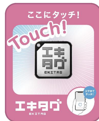
JR 四国の NFC タグのサイン

設置スタンプの取得時間、取得場所は、アプリ内スタンプ帳の各駅の「i」マークをタップし、ご確認ください。