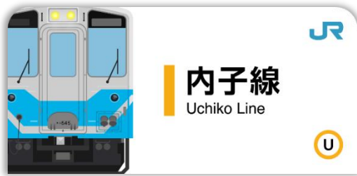
内子線スタンプ帳ラベル