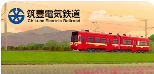
筑豊電気鉄道スタンプ帳ラベル