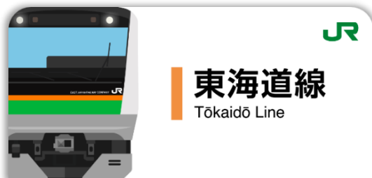
東海道線スタンプ帳ラベル