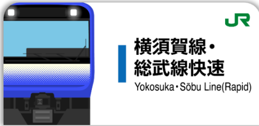
横須賀線・総武線快速スタンプ帳ラベル