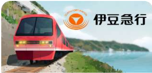
伊豆急行スタンプ帳ラベル