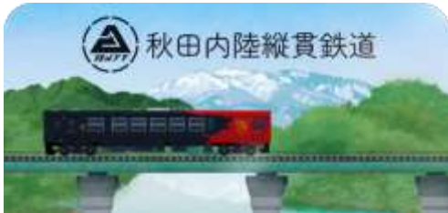
秋田内陸縦貫鉄道スタンプ帳ラベル