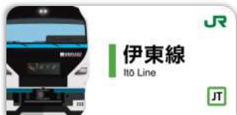
伊東線スタンプ帳ラベル