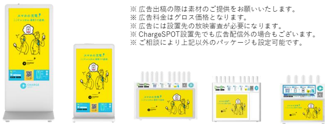
LL20 約42インチ M10 約24インチ S10 約13インチ S10-A 約10インチ S5 約7インチ 1ロール：360秒