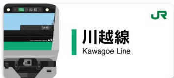
川越線スタンプ帳ラベル

デジタルスタンプ設置駅には NFC タグのサインを掲出いたします。設置スタンプの取得時間、取得場所は、アプリ内スタンプ帳の各駅の「i」マークをタップし、ご確認ください。