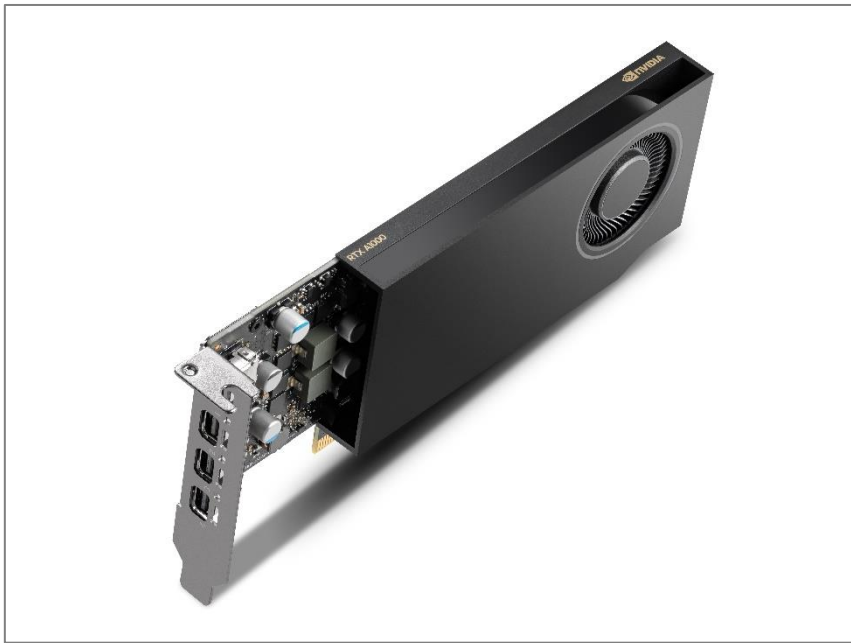
NVIDIA RTX™ A1000

エレクトロニクス商社の菱洋エレクトロ株式会社（本社：東京都中央区、代表取締役社長執行役員：中村 守孝、以下「菱洋エレクトロ」）は、生成 AI の性能を前世代比で最大 3 倍向上させる新 GPU 「NVIDIA RTX™ A1000」（以下「本製品」）の取り扱いを開始いたします。