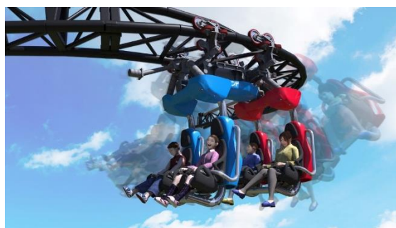
貸出画像「リポビタミンロケット☆ルナ」