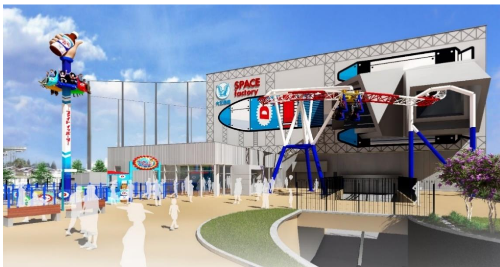
貸出画像「SPACE factory完成イメージ」