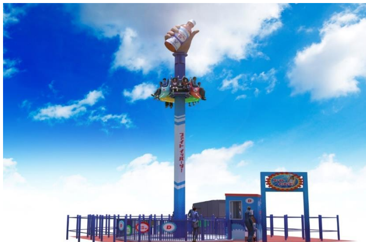
貸出画像「ファイト イッパーツ！」