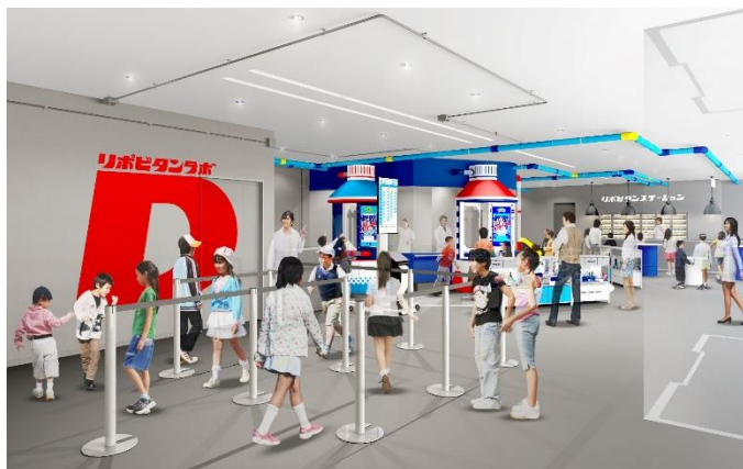
貸出画像「リポビタンラボ～リポ博士とヒミツの研究～」