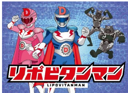
貸出画像「リポビタミンマン」