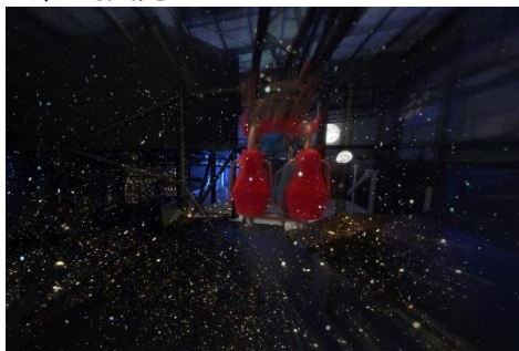
貸出画像「リポビタミンロケット☆ルナ 宇宙シーン」