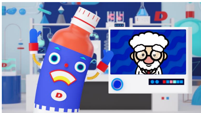
貸出画像「リポ博士と打錠機のダ・ジョン」