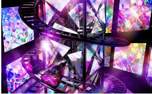
貸出画像「スパイラルリフト演出イメージ」

ファッションアイテムをモチーフにした映像を投影。スクリーンの上部から中央のミラーリフトへ向けてカラフルな照明で煽りを入れ、華やかな世界を演出！中央のミラーパネルが合わせ鏡になり、光が拡散します。