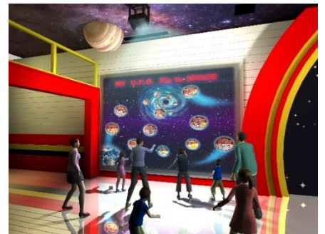
貸出画像「プロジェクションウォール」

お客様がマイU.F.O.ファクトリーで描いたマイU.F.O.のパッケージデザインをデータに取り込むと、壁面に映し出された宇宙空間の中にマイU.F.O.が投影されます。宇宙空間を飛び回るマイU.F.O.と写真が撮れる新たなフォトスポットとしてエントランスを賑やかに演出します。