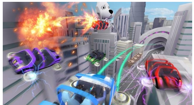
貸出画像「未来コースVRシーン イメージ」

超絶スピードと空中バトルが体験できる未来コースは、空中を高速走行しながら、他の車とレースをしている感覚のコースです。攻撃されたり、他の車がクラッシュしたりと、スピード&アクション満載です！100km～300km/hで空中や都市を疾走するイメージです。