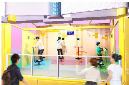
貸出画像「罫線印刷ローリングチャレンジ」

2つの印刷ローラーを回転させ、一定時間内に2つのローラーを指定の数だけ回転させたらクリアです。この工程では罫線を印刷する工程を体験できます。