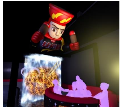
貸出画像「麺かきませスクリーン イメージ」