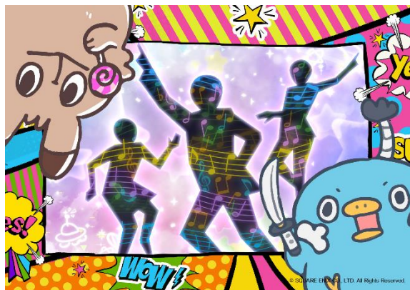
貸出画像「エクストラステージ」

映像と音楽に合わせて自由にパフォーマンスできるSNS映え間違いなしの体感型アトラクション。空間に浮かんでいるかのような映像の中でダンシング・ゲームを楽しむこのステージは、遊んでいるプレイヤーはもちろん、観ている人も一緒に楽しませてくれます。