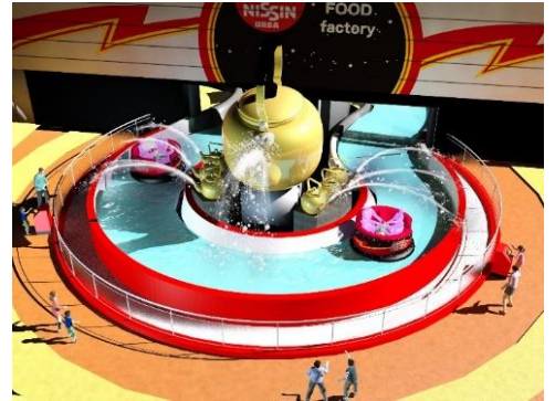
貸出画像「ケトラーいたずらショット盤 イメージ」

屋外にいるお客様もケトラーの手下になり、いたずら演出に参加してもらいます。巨大やかんの脇に小やかんが並び、水路の外に設置されたボタンを押すと水が出ます。通常時は4つの小やかんから水が発射されますが、いたずら演出が加わると6つの小やかんから水が発射されます。