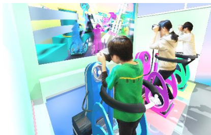
貸出画像「紙の裁断工程 イメージ」

手持ちVRゴーグルを使って、ノート工場内を進み、紙の裁断ゲームにチャレンジ。画面中央にターゲットがあり、紙にターゲットを合わせると紙が裁断されます。ノートの裁断の工程を体験できます。