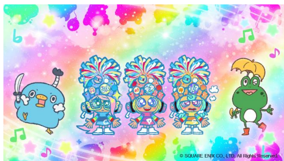
▲エクストラステージを盛り上げてくれる仲間たち