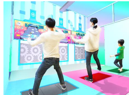
貸出画像「表紙のせダンシング！」

ノート紙がブロックエリアに来たときに、リズムに合わせて踏むと、表紙がのって得点になります。足を使って楽しめるダンシングゲームです。この工程ではノートの表紙乗せの工程を体験できます。