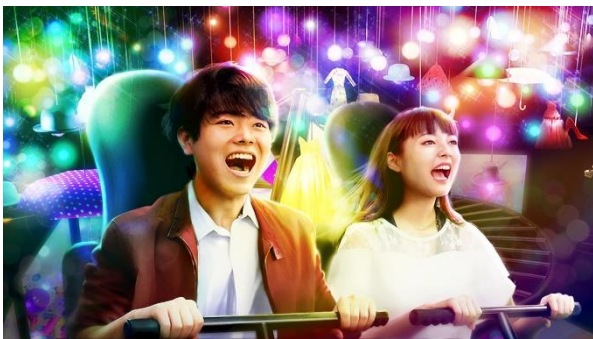
貸出画像「スマートフォン撮影イメージ」

※フィーチャーフォンほか、ホルダーで固定することができない携帯電話のコース内での撮影はできません。