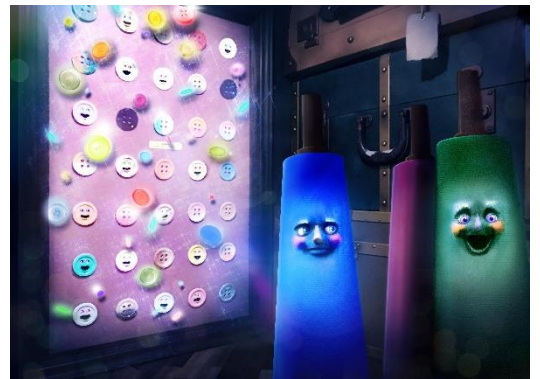
貸出画像「しゃべるファッションアイテム」

ジェットコースターの待ち列でボタンなどのファッションアイテムが生き物のように話しかけてきたり、動いている音や、影が見えたりすることで、ファッションワールドへ引き込まれていきます。