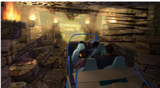
貸出画像「古代遺跡VRシーン イメージ」

ちょっとコワイ！ドタバタ・ワイルドな体験ができる古代遺跡コースは、前半にはジャングルの中を探検し、後半には遺跡の中で危険いっぱいのドタバタ感を体験してもらいます。20km～40km/hでジャングルや古代遺跡を疾走するような体感がお楽しみいただけます。