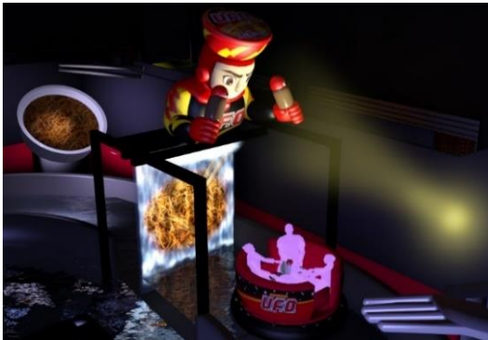
貸出画像「巨大ヤキソバンとミストスクリーン イメージ」

急流下りの最後には、ミストスクリーンと巨大ヤキソバンが登場。映像で日清焼そばU.F.O.を調理します。調理映像の中を突き抜けると、ソースの香りに加えて完成した日清焼そばU.F.O.が出現し没入感を高めます。