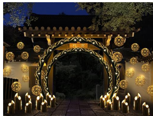
貸出画像「竹あかりで灯される聖門(イメージ)」

今回も、竹あかり演出集団「CHIKAKEN」がプロデュースします。 竹毬と竹灯籠のコラボレーションが、小路の先にある聖門を優美に 飾ります。※順路内に一部階段があります