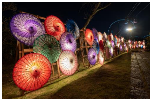
貸出画像「和傘のライトアップ(昨年の様子)」