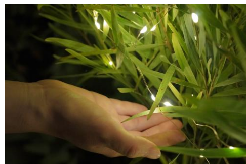
貸出画像「ポタニカルライト」