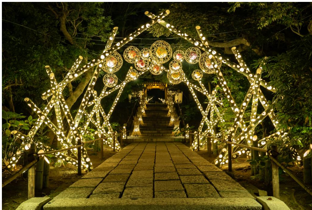
貸出画像「HANAあかり(昨年の様子)」

「HANAあかり」は竹に穴を開けてあかりを灯す約1,000本の竹あかりと、優美にライトアップされた樹木や花々・文化財により、園内が柔らかな光に包まれる和のイルミネーションイベントです。今シーズンも自然との共生を目指す竹あかり演出集団「CHIKAKEN」が装飾をプロデュースします。また、今回は花手水のライトアップや切絵灯籠の装飾など新登場のスポットが盛りだくさんです。都会の喧騒から離れた、夜の散策をお楽しみください。