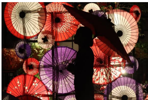
貸出画像「和傘貸し出し」

HANA・BIYORI公式Instagramアカウント(@hanabiyori8717)をフォローすると、提灯または和傘を1つ無料で貸し出します。