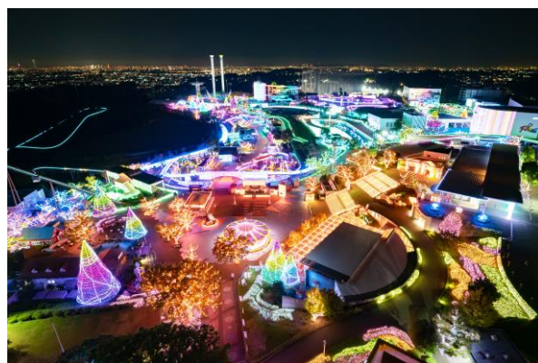
貸出画像「ジュエルミネーション 全景(昨年の様子)」