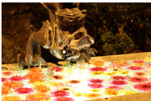
貸出画像「花手水のライトアップ」

HANA・BIYORI人気のフォトスポットにもなっている、手水舎の水面に彩り豊かな花を浮かべた「花手水」。HANAあかり開催期間限定で、水中をライトアップします。花びらの陰影をお楽しみください。