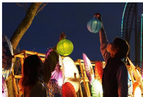
貸出画像「提灯貸し出し(イメージ)」