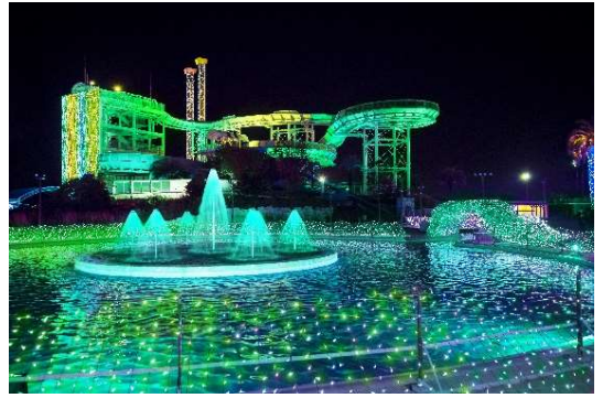
貸出画像「ジュエリー・スパイラル(イメージ)」