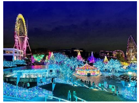
貸出画像「アースブルー・ジュエリーカラー(イメージ)」

正面入園口入ってすぐの太陽の広場とその周辺を中心に、新色のイルミネーションが登場します。光色はアクアマリンやサファイアなどの明るいブルー系をベースに、地表の約7割を占める「海」の澄んだ水をイメージしています。他にも森林をエメラルド、陸地をゴールデンサファイア、雲をダイヤモンド、最後に人々の愛をイメージしたルビーを組み合わせています。