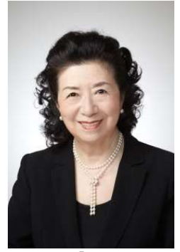
貸出画像「石井幹子氏」

2000年に照明デザインへの貢献により、紫綬褒章を受章。2019年に文化功労者、2020年には名誉都民に選ばれる。国内外での受賞多数。