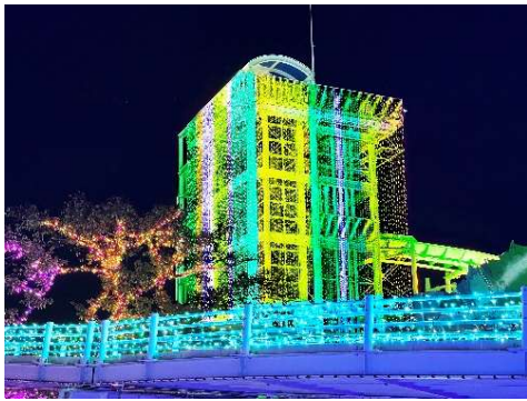
貸出画像「ジュエリー・タワー(イメージ)」

温暖化が進む地球上では、各所でCO2を吸収する森林の整備・保全に力が注がれています。「ジャイアントスカイリバー」は、自然、特に森林への愛をモチーフにグリーンを基調とした色で照らします。訪れる人々が、美しい「光の森」を眺めながら、地球への愛を深めるきっかけを促すエリアです。