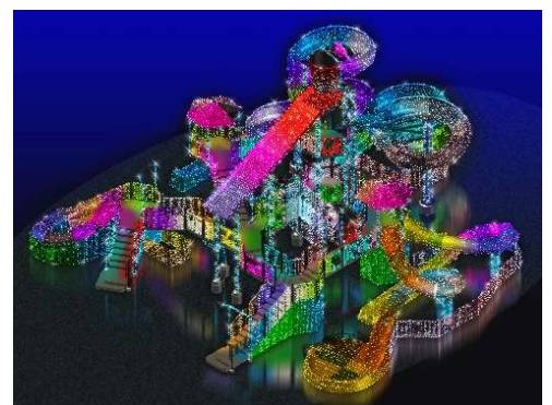
貸出画像「ラブリー・サンクチュアリ(イメージ)」

今年度プールエリアにオープンした「わいわいジャングル」が、様々な愛が共存するサンクチュアリ(聖域)をイメージしたシンボルオブジェとして登場します。様々なジュエリーカラーイルミネーションを使い、光の色がそれぞれに持つ個性を折り重ねます。