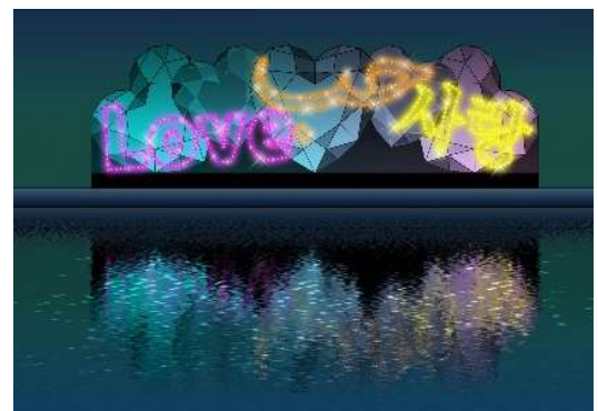
貸出画像「ラブ・ストリーム(イメージ)」

世界中に存在する愛の言葉を集め、色とりどりに照らし出します。世界中に広がる様々な国や文化における愛の多様性を表現します。