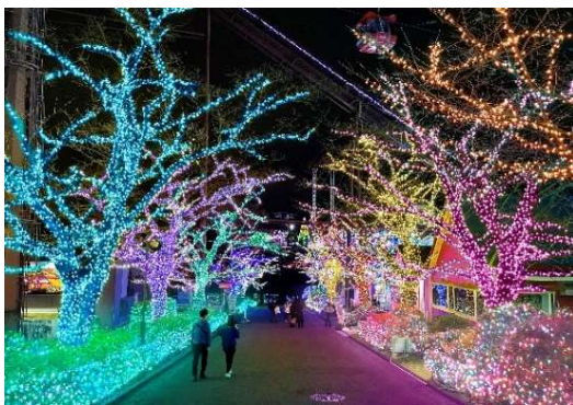
貸出画像「恋人たちのプロムナード(イメージ)」

桜並木の左右を、それぞれ暖色系と寒色系のイルミネーションに分けて彩ります。道を挟んで左右の光がお互いに惹かれあうようなプロムナードです。