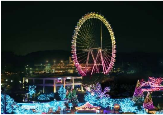
貸出画像「ラブ・グランオブジェ(イメージ)」

よみうりランドのメインシンボルでもある大観覧車は、上半分を金色、下半分をピンク色で照らし、深い愛情や思いやりの気持ちを表現します。