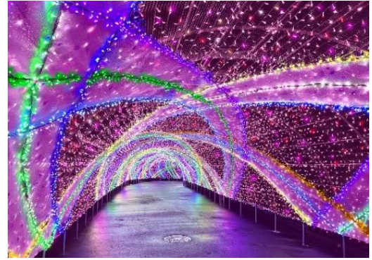
貸出画像「パサージュ・オブ・ラブ(イメージ)」

ピンクを基調とした、全長140mの光のトンネルです。幾重にも交錯するカラフルなラインを、家族、友人、恋人など、日常で交わる人々の愛に見立てます。