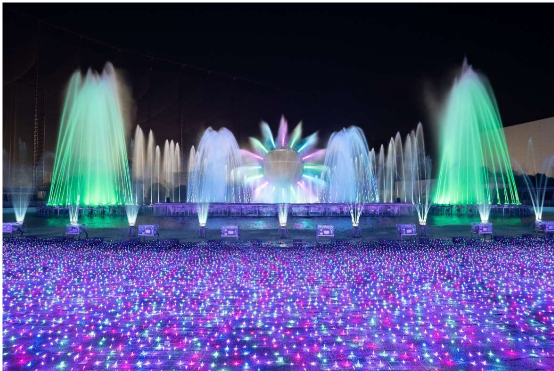
貸出画像「噴水ショー(イメージ)」

毎年大人気の噴水ショーを今年も「波のプールエリア」で開催します。高さ15mの巨大リングのウォータースクリーン映像や188本の噴水、レーザーと炎による演出で圧倒的なスケールでお届けするショーは必見です。今年は、地球への愛をテーマとした大噴水ショー「LOVE EARTH (地球への愛)」のほか、2種の噴水ショーが楽しめます。