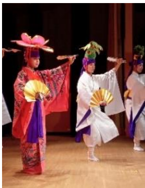
貸出画像「琉球舞踊 伊是名の会」

沖縄と奄美に伝承される民族舞踊を紹介。古典の持つ優雅さと躍動感溢れるステージで多くの観客を魅了する。伝統と創作舞踊を融合させた斬新な舞台は海外からも高い評価を得ている。