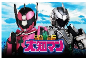
安全+第一 大知マン