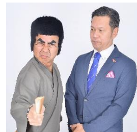
貸出画像 「護得久栄昇 with. 仲座健太」

肩書は護得久流民謡研究所会長。沖縄のお笑い芸人No1を決めるテレビ番組に出演以来、沖縄で人気を呼びTV、県外のラジオ局レギュラー、CMに60本以上出演するなど沖縄での注目度No1コントキャラ。