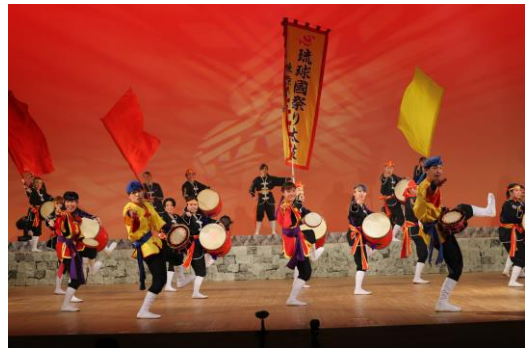
貸出画像「琉球國祭り太鼓」

沖縄の伝統芸能エイサーをベースにした、独自の振り付けとダイナミックなバチさばきが特徴の創作太鼓集団。地域のお祭りからメディア出演まで、幅広く活動している。