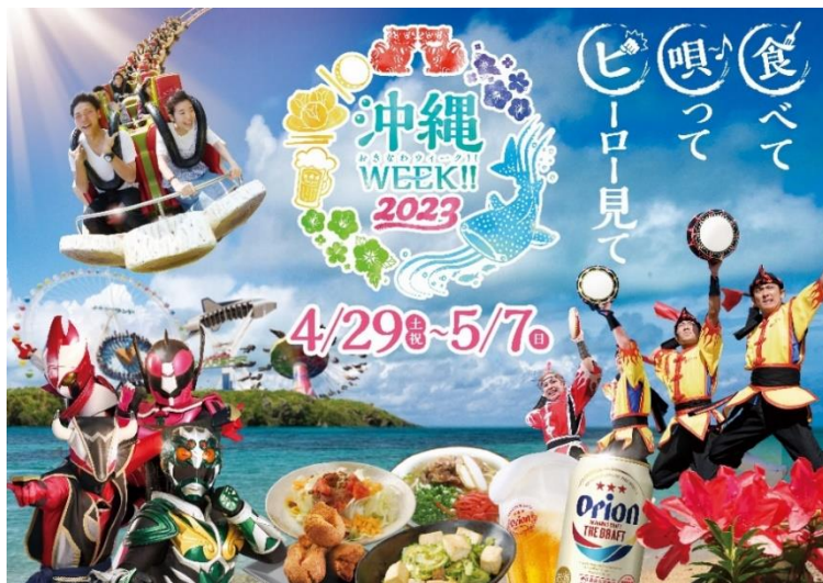
貸出画像「沖縄WEEK!!2023 メインビジュアル」

沖縄の魅力やお子さまも楽しめるイベントが詰まったよみうりランドで、ゴールデンウィークにご家族やご友人と楽しいひとときをお過ごしください。