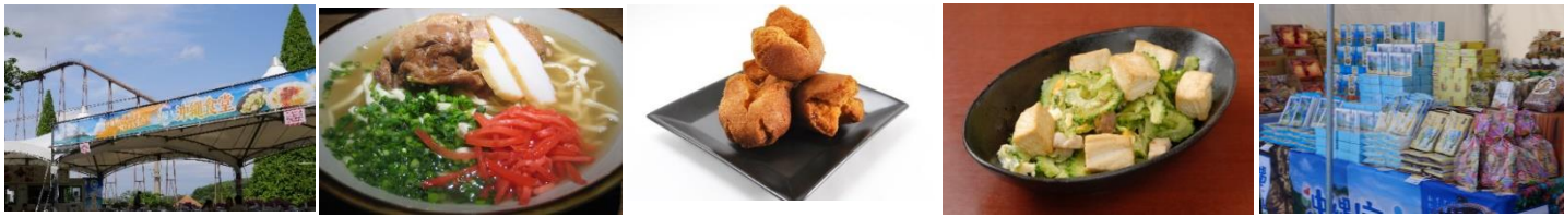
貸出画像「沖縄食堂・物産店」(左から順に、沖縄食堂、ソーキそば、サーターアンダギー、ゴーヤチャンプルー、物産店)

昨年大好評だった沖縄食堂や沖縄物産店では、ゴーヤチャンプルーやソーキそば、サーターアンダギーなどのおいしい沖縄料理や、ブルーシールアイスなど沖縄県を代表するお菓子、県産品・土産品を販売します。