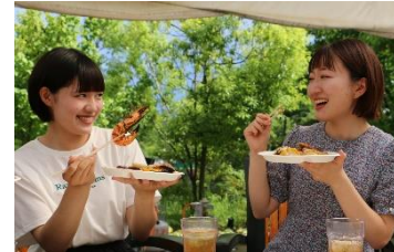
貸出画像「バーベキューパークJU-JU」