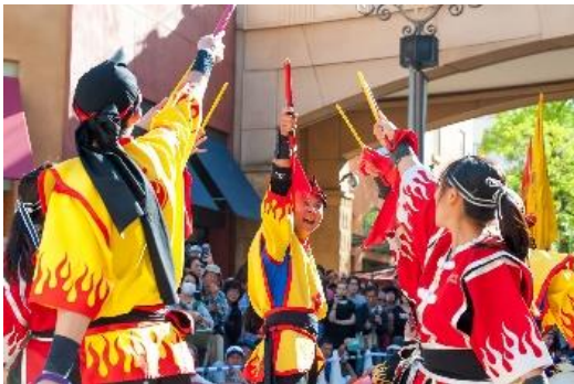
貸出画像「琉球舞団 昇龍祭太鼓」

2010年2月に結成された琉球舞踊団。沖縄の伝統芸能であるエイサーの礎を守りつつ、振付に沖縄空手の型や琉球舞踊の動きを取り入れている。創作性の高い振付や演出を特色とした演舞で、琉球芸能・沖縄の魅力を発信。