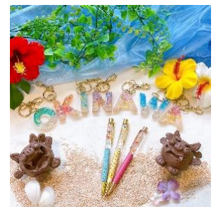
貸出画像「様々なワークショップ(イメージ)」