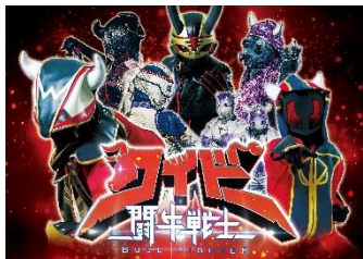
闘牛戦士ワイドー