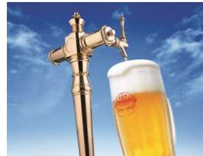
貸出画像「オリオンビール(イメージ)」