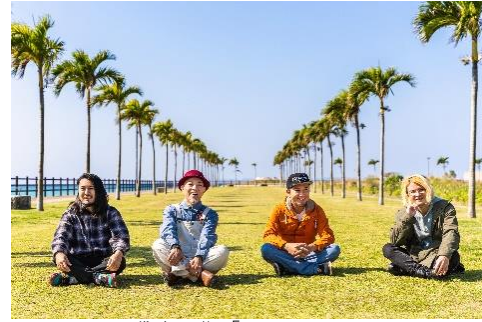
貸出画像「かりゆし58」

2006年2月ミニアルバム『恋人よ』でデビュー。母への感謝の気持ちをストレートに唄った「アンマー」が多くの共感呼び、日本有線大賞新人賞を受賞。2022年2月に9thフルアルバム『七色とかげ』をリリース。今年でデビュー17周年を迎え、沖縄で生まれ育った彼らならではの『島唄』を全国に向け唄い続けている。