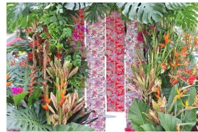
貸出画像「沖縄風フォトスポット(イメージ)」

https://www.yomiuriland.com/hanabiyori/information/