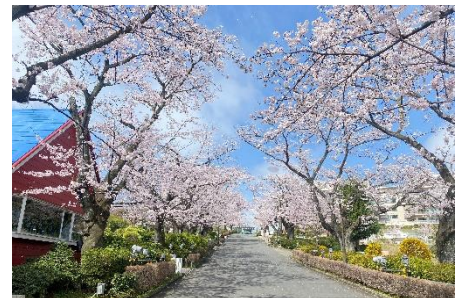
貸出画像「桜並木(昨年の様子)」

歩きながら桜を楽しむもよし、休憩スペースに腰を下ろしてゆっくり眺めるもよし、のお花見スポット。夜はサクラ・プロムナードになり、昼と夜で異なる景色をお楽しみいただけます。