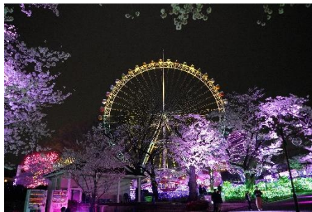
貸出画像「大観覧車と桜(昨年の様子)」

明るく幸せな日々が始まりを連想させる日の出をイメージに輝く大観覧車と、ライトアップされた周辺の桜とのコラボレーションは必見です。