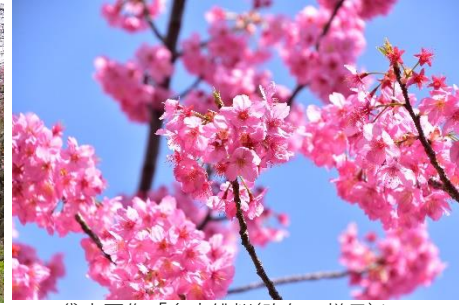
貸出画像「多摩緋桜(昨年の様子)」