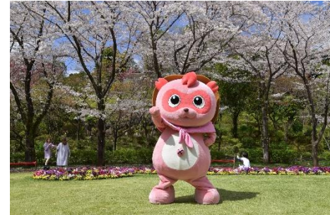
貸出画像「ピンぽん(過去の様子)」