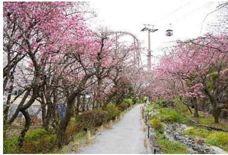
貸出画像「多摩緋桜が咲く散策路(昨年の様子)」

1980年頃、ソメイヨシノに代わる「よみうりランドの名物」となるオリジナルの桜を作りたいという想いから生まれた桜です。ソメイヨシノと比べ、色が濃く鮮やかで、開花時期が早く見ごろの期間も長いのが特徴です。