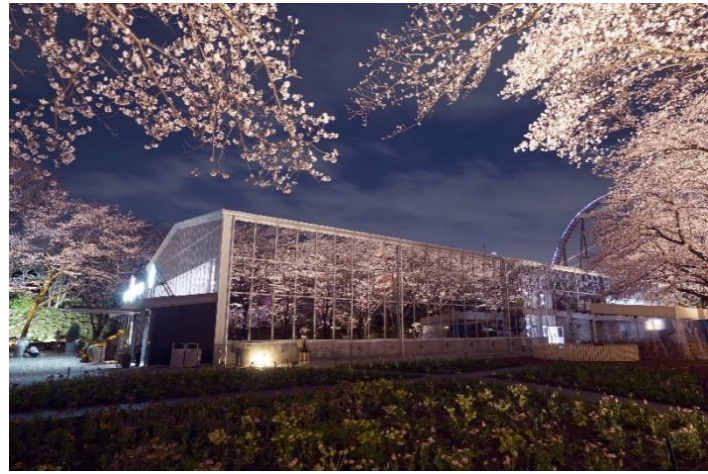
貸出画像「夜桜びより(昨年の様子)」

※園内には缶・ビン類、アルコールのお持込みはできません。お弁当のお持込みは可能です