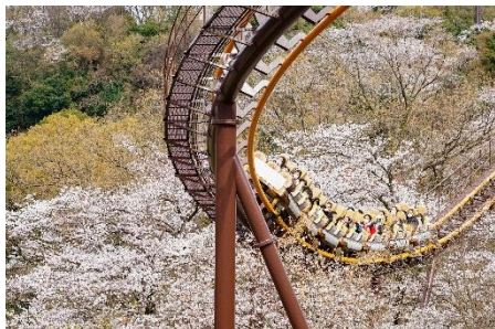
貸出画像「バンデット(昨年の様子)」

人気No.1のジェットコースター「バンデット」は、“お花見コースター”に大変身！最高地点で桜を見下ろしたと思ったら、猛スピードで桜の中を駆け抜けます。