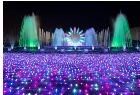
貸出画像「噴水ショー」

高さ12mの巨大リングのウォータースクリーン映像や185本の噴水、レーザーと炎による演出で圧倒的なスケールでお届けする噴水ショー。