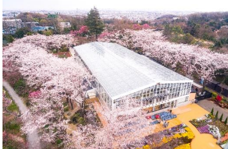
貸出画像「HANA・BIYORIの桜(昨年の様子)」