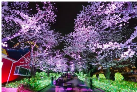
貸出画像「サクラ・プロムナード(昨年の様子)」

桜のイメージを強調するような、薄いピンクのライトアップで演出します。夜桜とジュエルミネーションが一度に楽しめる一押しスポットです。