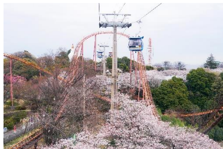
貸出画像「ゴンドラスカイシャトル(昨年の様子)」

京王よみうりランド駅と入園口を結ぶゴンドラから眺める満開の桜は、まるでピンクのじゅうたんの道を飛んでいるよう！ (片道300円、往復500円)