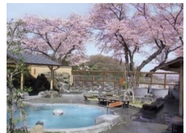
貸出画像「露天風呂からの桜(過去の様子)」

[URL] https://www.yomiuriland.com/okanoyu/index.html