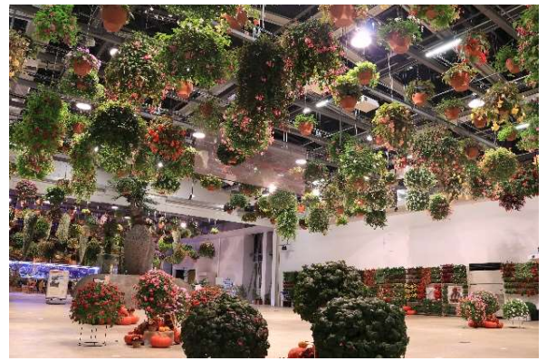
貸出画像「夜のフラワーシャンデリア」

メインの温室「HANA・BIYORI館」では、ライトアップされたフラワーシャンデリアをご覧ください。300鉢を超えるフラワーシャンデリアが幻想的に照らされる様子が見応えがあります。