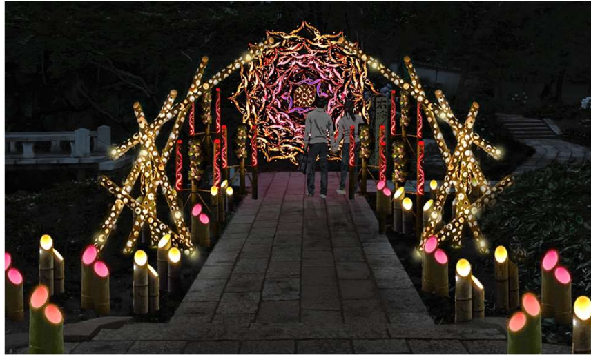
貸出画像「花曼荼羅(イメージ)」

今回も、竹あかり演出集団「CHIKAKEN」がプロデュースします。美しい石畳と、竹毬や竹灯籠とのコラボレーションが織りなす小路の先では、竹で作られた美しい花曼荼羅がお迎えます。時間によって色が変化するため、様々な雰囲気をお楽しみいただけます。※順路内に一部階段があります