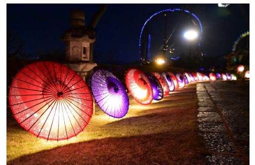
貸出画像「文化財×和傘(昨年の様子)」