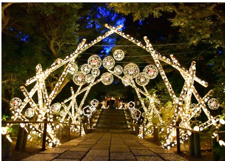
貸出画像「HANAあかり(昨年の様子)」

「HANAあかり」は竹に穴を開けてあかりを灯す約1,000本の竹あかりと、優美にライトアップされた樹木や花々・文化財により、園内が柔らかな光に包まれる和のイルミネーションイベントです。今シーズンも自然との共生を目指す竹あかり演出集団「CHIKAKEN(ちかけん)」がプロデュースする竹あかりと、文化財「聖門(ひじりもん)」のライトアップなど、光と花が織りなす美しい光景をご覧ください。今年は竹組みの花曼荼羅(はなまんだら)が、時間により光の色彩を変え様々な趣を演出します。日本の古き良き文化財と穏やかな光が紡ぎだす、幻想的な空間が広がります。