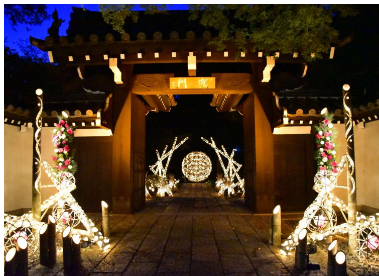
貸出画像「聖門×竹あかり(昨年の様子)」