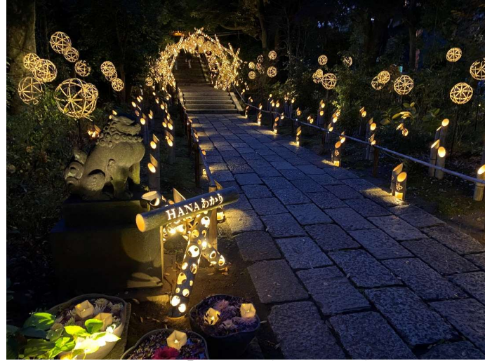
貸出画像「花灯小路(昨年の様子)」