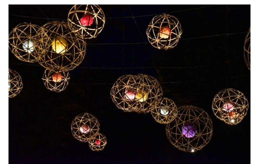
貸出画像「竹毬フラワーシャンデリア(昨年の様子)」

園内の散策路を約500本の竹灯籠で照らします。また今シーズンは散策路の装飾の一部にも、HANA・BIYORI名物のフラワーシャンデリアをイメージした竹毬が登場します。