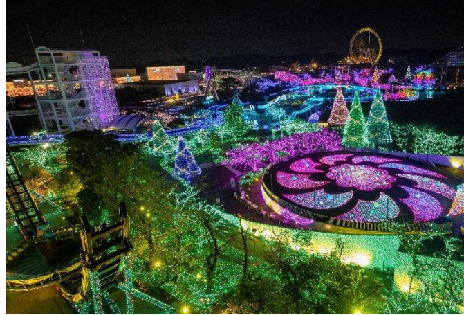
貸出画像「ジュエルミネーション(昨年の様子)」