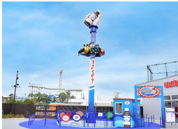
貸出画像「ファイト イッパーツ！」