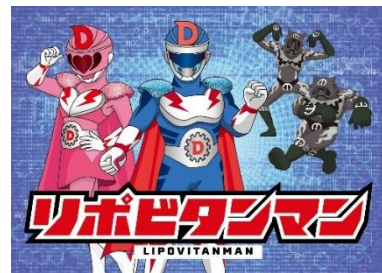
貸出画像「リポビタミンマン」

月に向かって出発だ！待っててね、リポビタミンガール！今すぐ元気を届けに行くから。