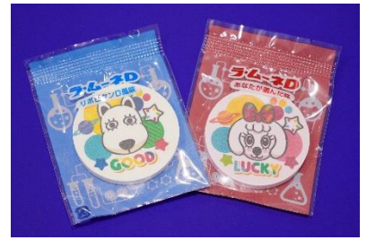
貸出画像「ラ・ムーネD②」