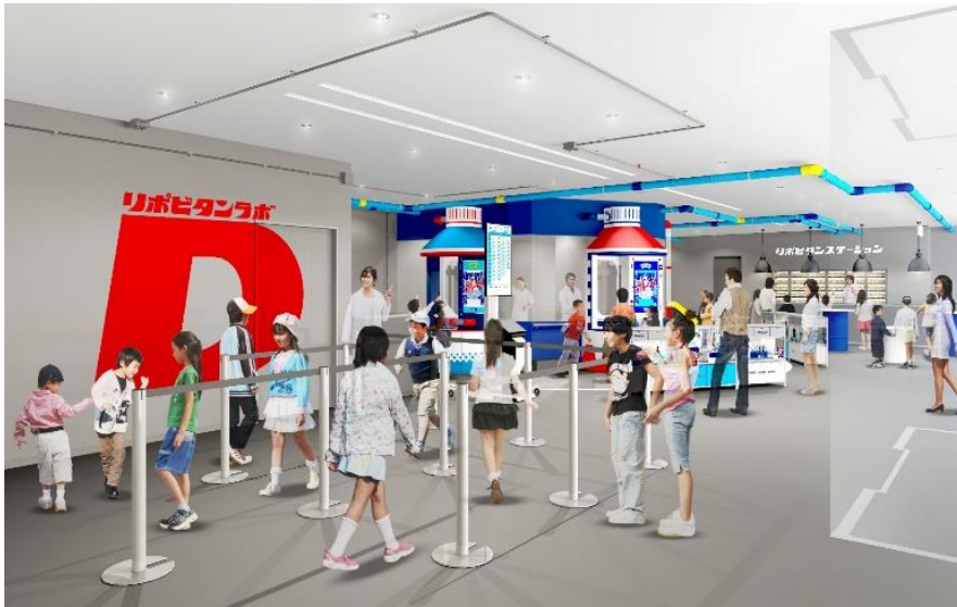
貸出画像「リポビタミンラボ～リポ博士とヒミツの研究～」