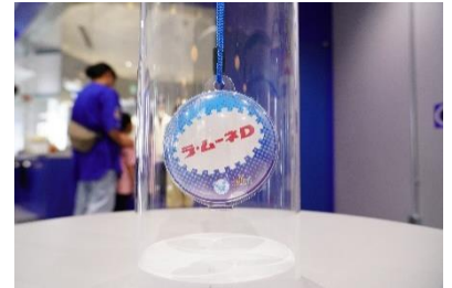
貸出画像「ラ・ムーネD①」