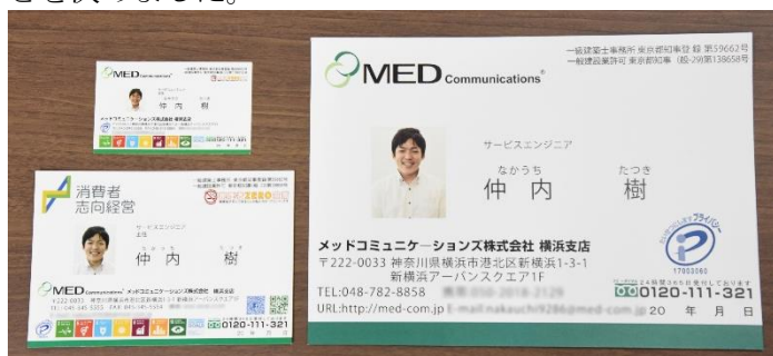
左上：通常サイズ、左下：BIG 名刺、右：超 BIG 名刺

当社では通常サイズの名刺の他にハガキサイズの名刺（以後 BIG 名刺）を使用しています。この BIG 名刺は裏面がアンケートハガキになっており、アンケート回答後にポスト投函してもらい当社のサービスに対する満足度調査を行ってきました。そのため顧客には手元保管用の通常名刺も併せて配布しています。しかし、顧客からは BIG 名刺の方が見やすいからと BIG 名刺を保管してしまうケースが多くなったため、一部の社員から通常サイズの名刺を廃止し、今後 BIG 名刺と、B5 サイズに拡大した名刺（以後超 BIG 名刺）の 2 種類を使用することを決めました。