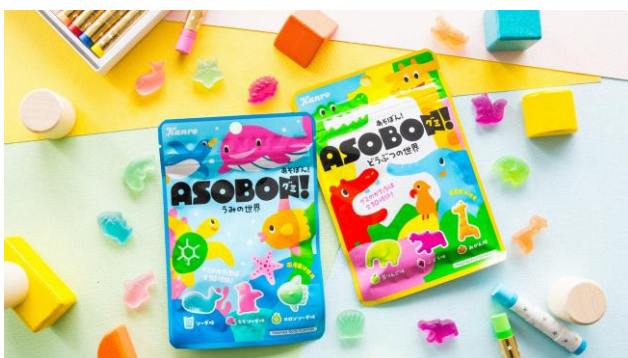
「あそぼん！グミ」商品写真