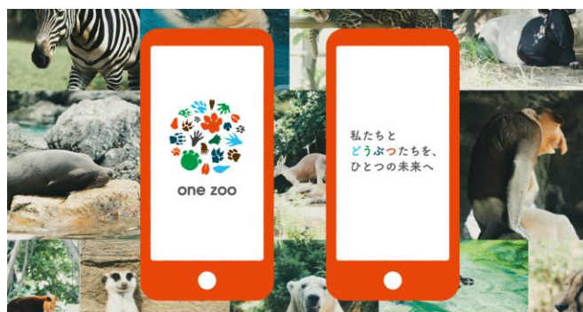
「one zoo」アプリ イメージ写真