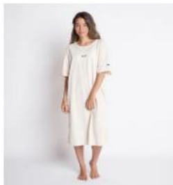
B 賞 ROXY T シャツワンピース

『ファシオ』ブランドサイト https://www.kose.co.jp/fasio/