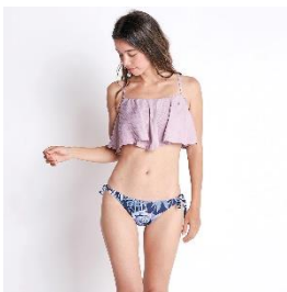
A 賞 ROXY ビキニセット