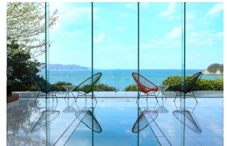
スターダストギャラリー