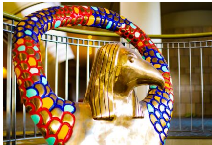
Niki de Saint Phalle 「Horus」