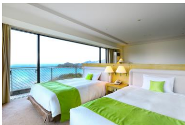
コーナーデラックス

『だんらん』は、お部屋から国立公園の森林と青い海をご覧いただける「TAOYA志摩」で唯一の和室です。大人二人と添い寝のお子様も一緒に寝られるデイベッドや、お子様の身長に合わせて設計された“親子シンク”などを設置しました。グループやご家族だけではなく、3世代グループまで幅広くご利用いただけます。『KATARAI』は「皆で語り合える部屋」をテーマにしたコンセプトルームです。コーナーから広がるように設置したおしゃれな2段ベッドが特徴です。2段ベッドはハシゴで上るタイプではないため、お子様も安心してご利用いただけます。