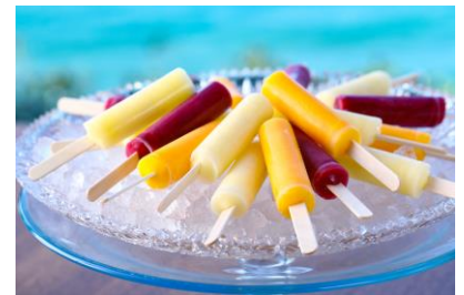
湯上りサービス処 アイスキャンディー