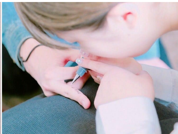
※左：ジャグアート 右：施術イメージ