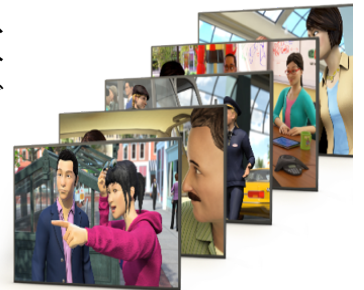
【製品画面イメージ】

「ReFLEX」では、1日1回25分間のオンラインプログラムを通じて、反射的な英会話スキルを身につけることを目的としています。同プログラムは、英語の音の違いを聞き分けて発音を強化する「Skills」、日常の様々なシーンで行われる会話をロールプレイング形式でトレーニングする「Rehearsal」、ネイティブコーチ(アメリカ人)とのマンツーマンのライブレッスン「Rosetta Studio™」の3つから構成されています。飲み物の注文から、タクシーの乗車、社内での打ち合わせ、海外出張などバラエティに富んだシーンが登場し、毎日、生きた英語に継続的に触れることで、英語を「話す」自信の向上につながります。また、最先端のテクノロジーを活用したスピーチ解析機能とAI(人工知能)の技術により、各自の英語力や進捗度によって、プログラムの内容が自動的にカスタマイズされ、実用的な英会話を効率よく身につけられるようになっています。