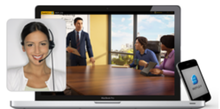
【製品イメージ画像 ※4】