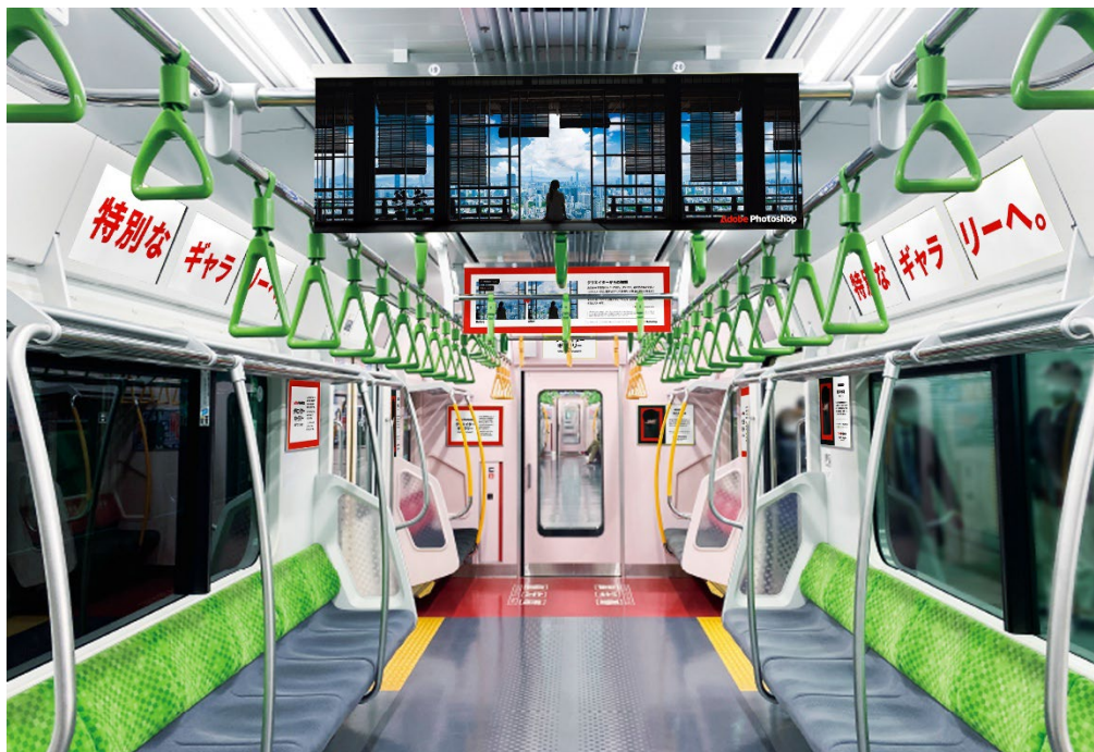
<3号車> 晴れのちく森