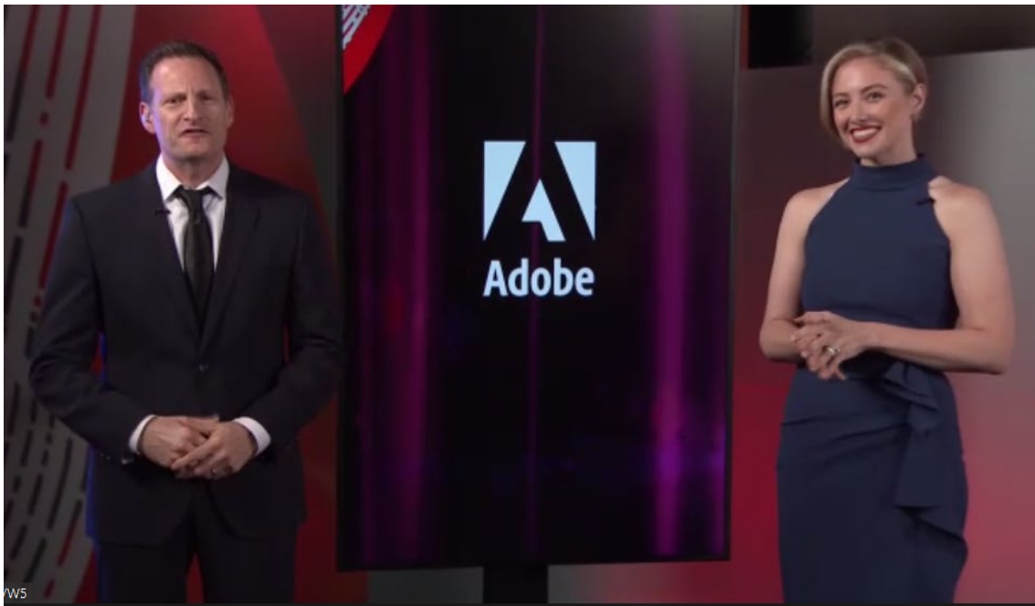
「2022 Adobe Experience Maker Awards Virtual Gala」 イベントの様子

2022 Adobe Experience Maker Awards の国内ファイナリストと受賞者および受賞企業は以下の通りです。