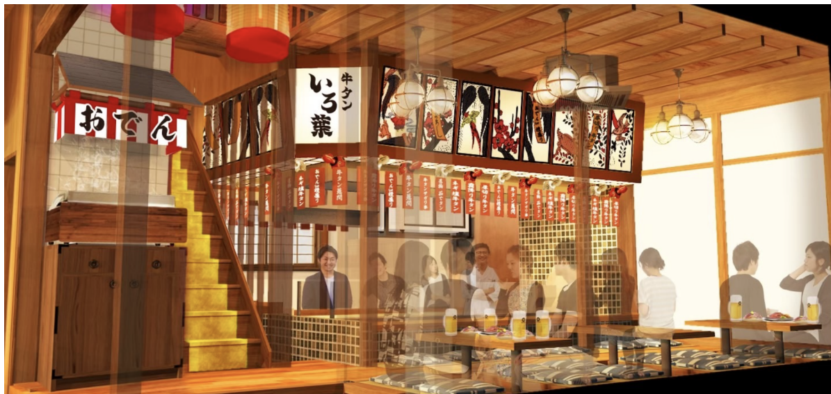
【牛タンいろ葉 内観イメージパース】