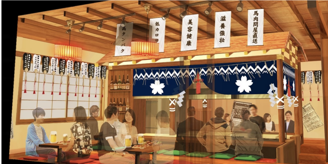
【富士乃馬 内観イメージパース】