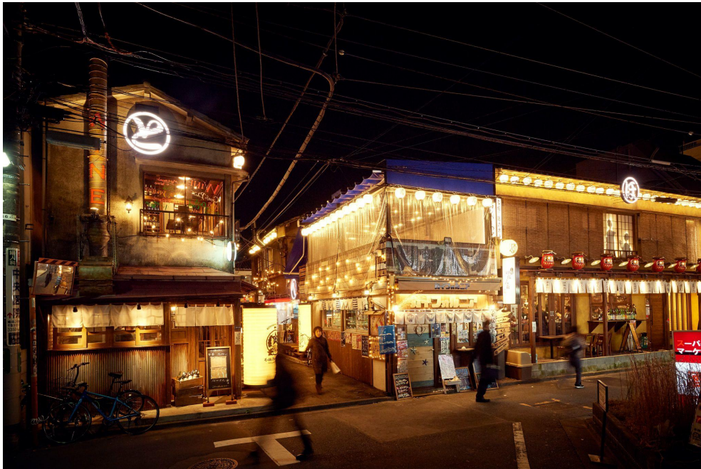
【古民家再生プロジェクト”ほぼ新宿のれん街”】

『綱島のれん小路』は、その第4弾としてのプロジェクトとして開業。規模は小規模でありながら、古民家を再生したノスタルジックな雰囲気はそのままに。神奈川に初進出の『綱島のれん小路』にご期待下さい。