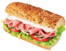
生ハム&マスカルポーネ