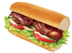
てり焼きチキン ～焦がし醤油仕立て～