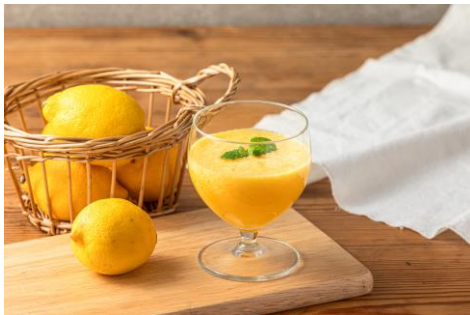
シトラスレモンスムージー