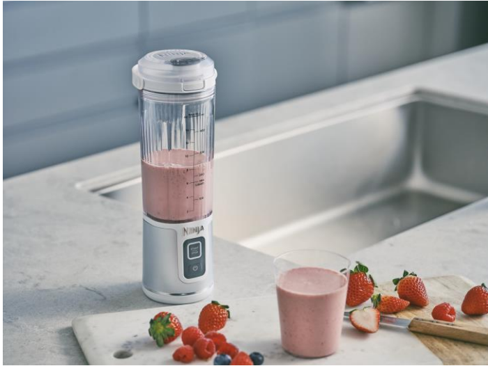
ミックスベリースムージー