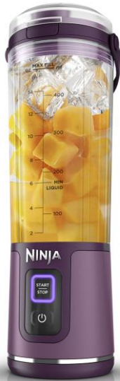
BC151JPR パッションフルーツ