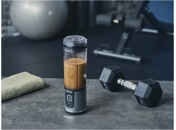
チョコレートプロテインシェイク