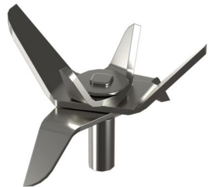
強靱なステンレス製6枚刃（※刃は取り外し不可）