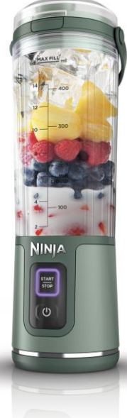
BC151JEM フォレストグリーン