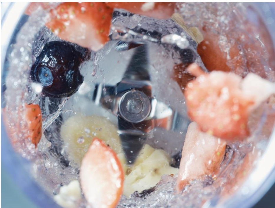
角氷や冷凍フルーツもしっかり砕く

パワフルなモーターと、強靱なステンレス製6枚刃を搭載し、角氷や冷凍フルーツもしっかり砕いて滑らかに仕上がります。スムージーやジュースだけではなく、ドレッシング、スープ、ソース、プロテイン、離乳食などといった幅広い用途でお使いいただけます。また、パワフルなのに音が静かなので、時間や場所を気にせずお使いいただけます。