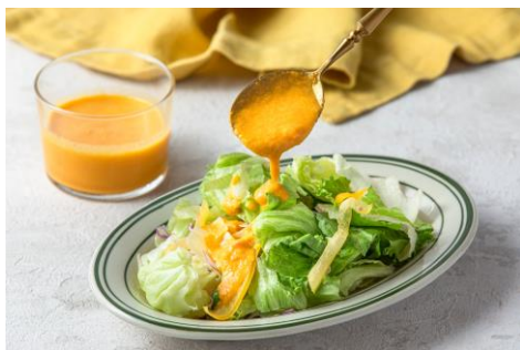
にんじンドレッシング