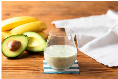
黒ごまアボカドバナナジュース