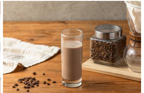
コーヒーバナナスムージー