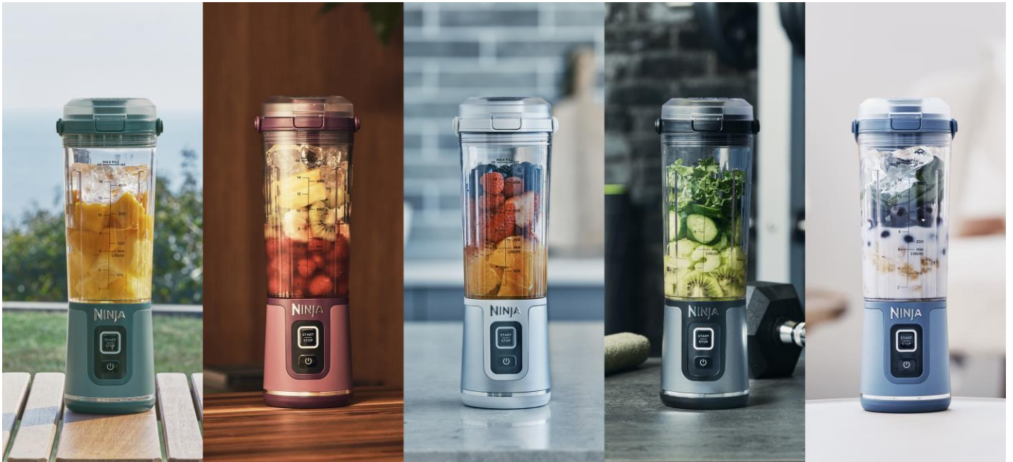
左から、BC151JEM フォレストグリーン / BC151JPR パッションフルーツ / BC151JWH ホワイト / BC151JBK ブラック / BC151JNV デニムブルー

キッチンに出しておいたり、外にも持っていきたくなるファッショナブルなデザインで、インテリアや好みに合わせて選べる5色展開になっています。