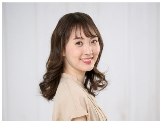
仕上がりのイメージ