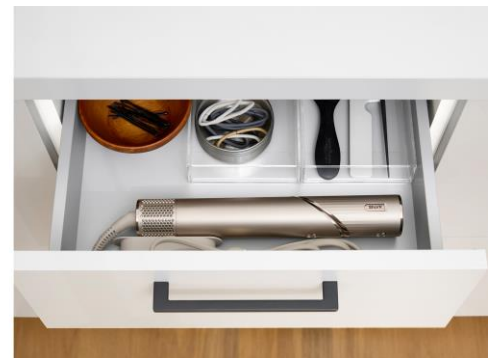
持ち運びや収納しやすいサイズと形状