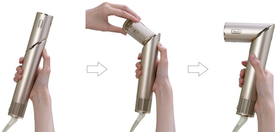
ワンアクションでスタイラーからドライヤーに変身

宿泊先で使い慣れたドライヤーを使いたい方、スパやサウナ、フィットネスジムでワークアウトした後や、出先でスタイリングを直したい時、など気軽に様々な場所でお使いいただけます。