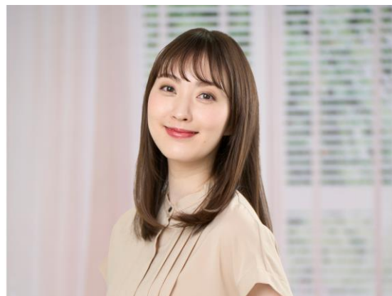
仕上がりのイメージ