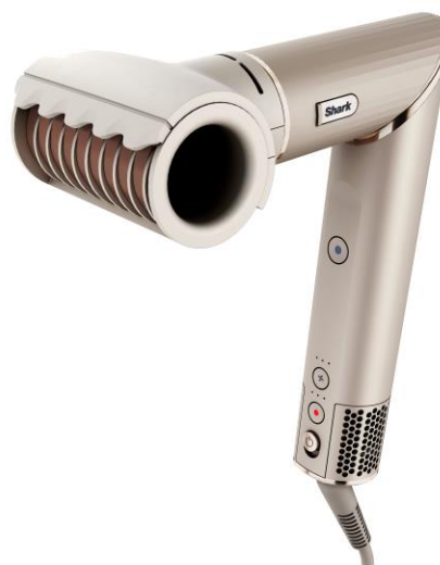
つるツヤローラー