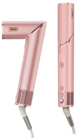
フラミンゴピンク(HD434JPK)