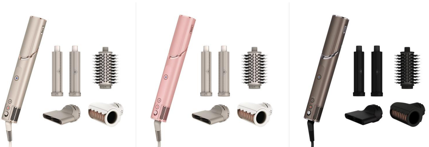
左から、ストーン (HD434JSL) / フラミンゴピンク (HD434JPK) / モカシルバー (HD434JBR)