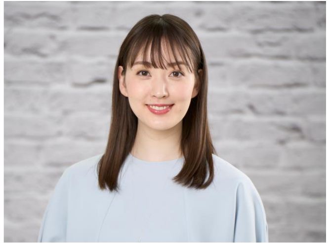
仕上がりのイメージ