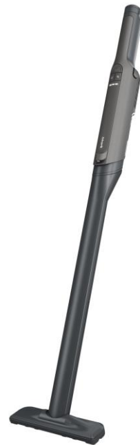
「フローリング用延長ノズル」付属 (※ WV416JGYのみ)