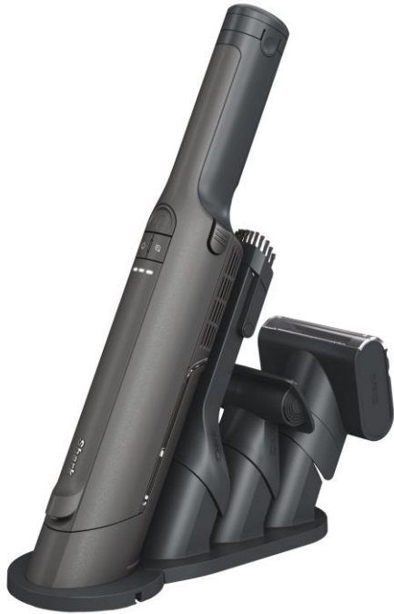
WV416JGY チャコールメタル