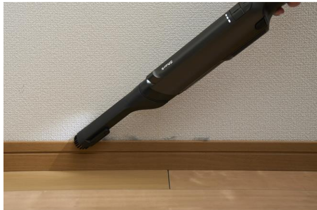
隙間用ノズル：部屋の角や隙間、車内などの狭いスペースの掃除に便利