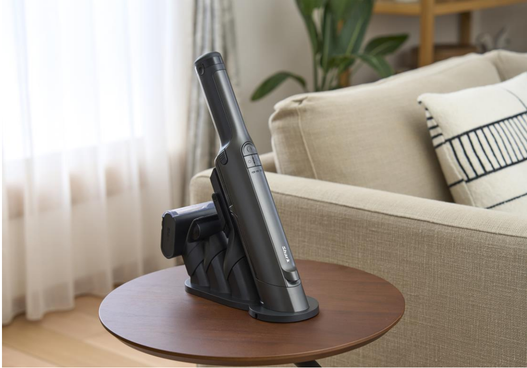
WV416JGY チャコールメタル