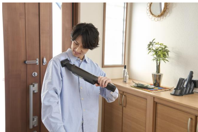
マルチノズル：小型ブラシで細かいゴミを吸引。ファブリックの掃除に最適