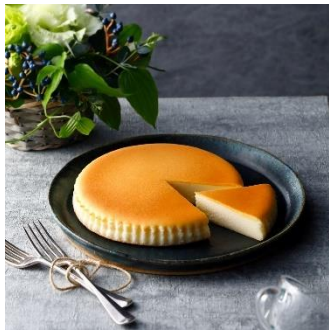
御用邸チーズケーキ

今回は、1994年の発売から今年30周年を迎えた「御用邸チーズケーキ」や海外で人気の“抹茶”フレーバーの「御用邸抹茶チーズケーキ」など、『チーズガーデン』の魅力を感じていただける商品をご提供いたします。