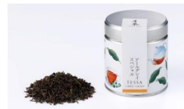
アールグレイスペシャル

セイロンのすっきりした風味と栃木県産のとちおとめの甘酸っぱい香りが華やかな味わいです。