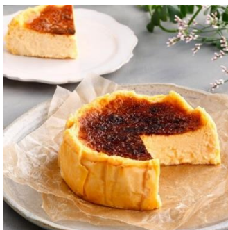
バスクチーズケーキ

「那須御養卵」の卵黄だけを使ったチーズガーデンオリジナルのバスクチーズケーキは、チーズのコクと卵の濃厚さをお楽しみいただけます。