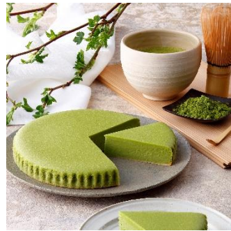
御用邸抹茶チーズケーキ

数種類のチーズをブレンドした生地、日本有数の生産地である西尾産の抹茶を練りこむことで、抹茶の爽やかな香りと旨みがお楽しみいただけます。