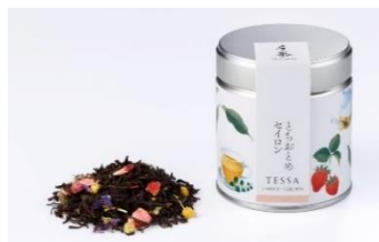
とちおとめセイロン

柑橘の香りが爽やかな気品あるアールグレイ。手茶8種類のなかで、人気No.1の茶葉です。