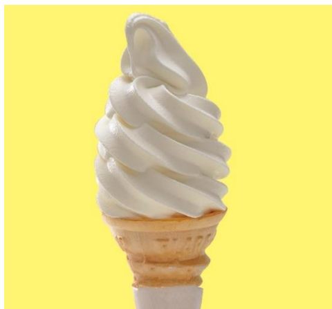
瀬戸内レモンソフト