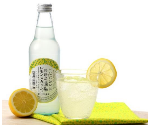
淡路島 藻塩レモンスカッシュ