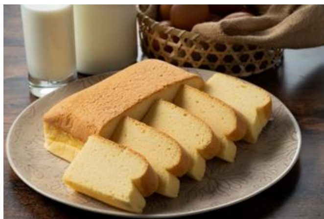
台湾カステラ（レモン味）