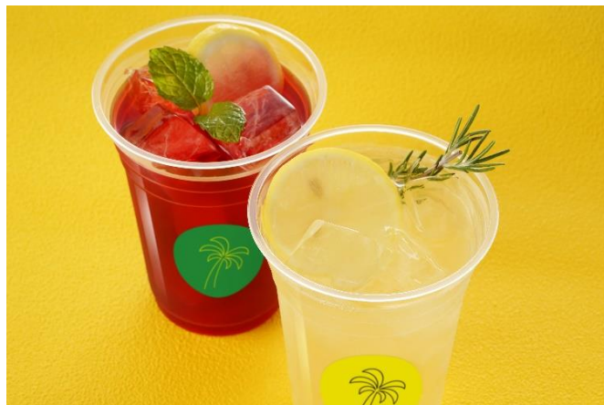
左：レッドベリーレモネード 右：レモンピール入りレモネード