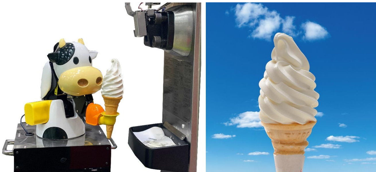
左：ソフトクリームロボット「淡路ロボソフト」提供中／右：淡路島牛乳使用「淡路ロボソフト（ミルクソフトクリーム）」

全国のサービスエリア内で初登場の「ソフトクリームロボット」が作る「淡路ロボソフト」で、暑い夏に涼しさを提供します。