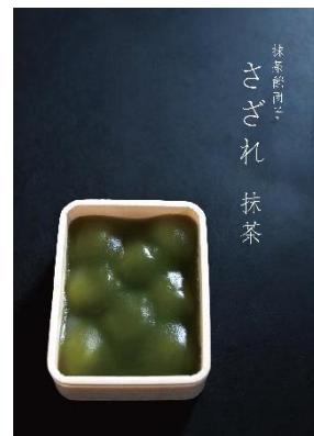
■抹茶餡団子 さざれ抹茶