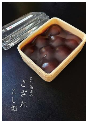
■こし餡団子 さざれこし餡