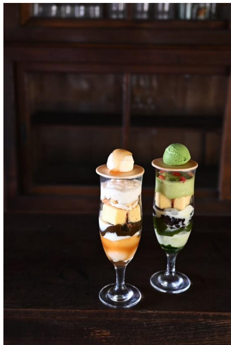
■WA YOUパフェ かさね(みたらし)、かさね(抹茶)

淡路島店限定のカフェメニューや手土産にもおすすめな和菓子を販売。ここでしか味わえない甘味をお楽しみください。