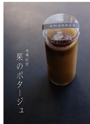
■秋季限定 栗のポタージュ