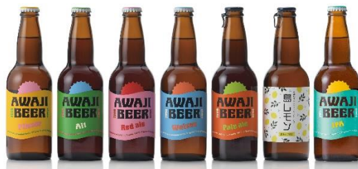
< AWAJI BEER 7種類イメージ >