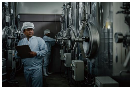
製造職人が細心の注意を払う AWAJI BREWERY内

淡路島を囲む海中の音を聴かせながらビール酵母を発酵・熟成させる当社独自の「アイランド製法」で製造。寄せる波の静かな音色。醸造中のビール酵母に島の海の音を聴かせて発酵・熟成させるのがあわぢびーの秘密。島の時間がおいしく育てています。クラフトビール本来の深い味わい、そして豊かな香りを大切に仕上げました。淡路島の恵まれた海の幸、新鮮なお魚の味を壊さず、楽しんでいただける柔らかい味わいです。