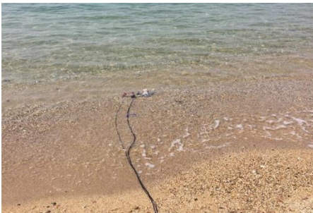
淡路島を囲む海での採音