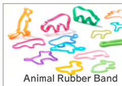
Animal Rubber Band

+d は、デザイナーがモノに込めた想いやメッセージを世界に届けるブランドです。初めて製品化したアニマルラバーバンドをはじめ、100名を超えるデザイナーのメッセージを形にしています。