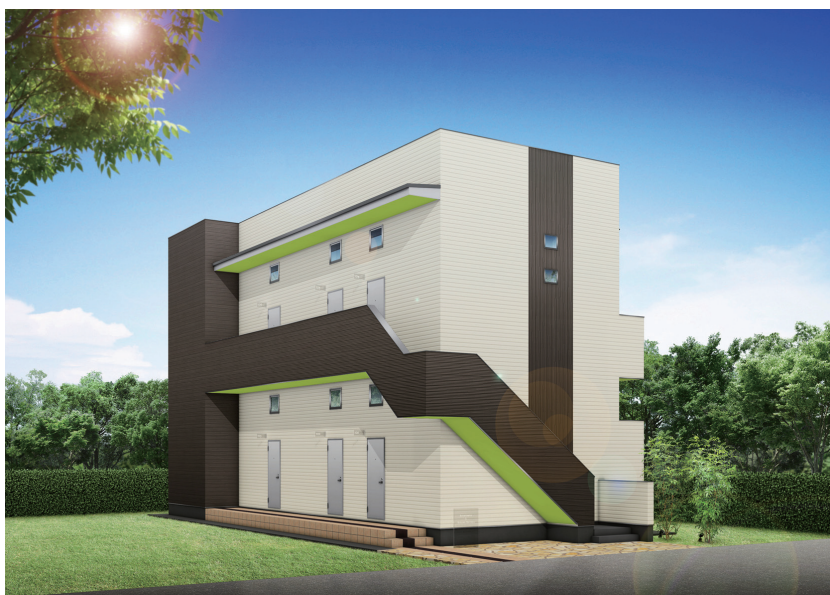
物件イメージパース ※実際の物件とは異なります。