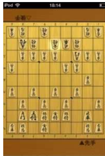
↑居飛車対振り飛車の基本的な駒組み ここまで組めれば、簡単には負けない

序盤の駒組みに自信のある人は、「テスト」を先にチャレンジして、わからなかったところだけ解説を確認する、といった勉強法も有効です。