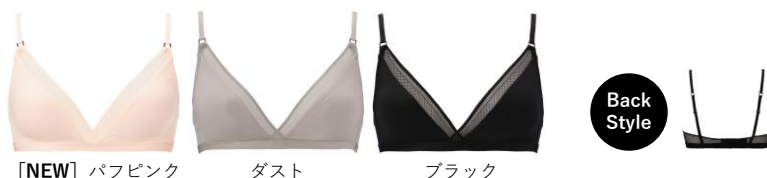
[NEW] パフピンク ダスト ブラック