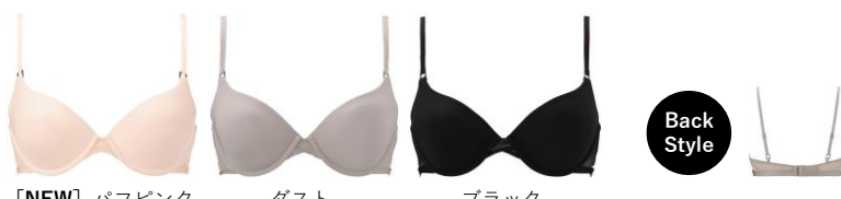
[NEW] パフピンク ダスト ブラック