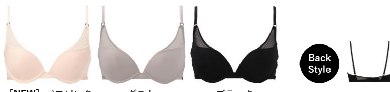
[NEW] パフピンク ダスト ブラック