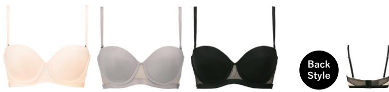
パフピンク ダスト ブラック