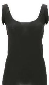
タンクトップ (ボートネック)