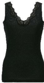
タンクトップ (Vネック)