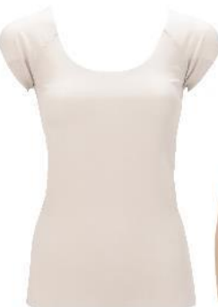
フレンチ袖トップ