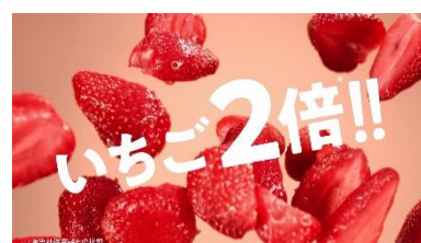
安達: いちご2倍でおいしさUP!