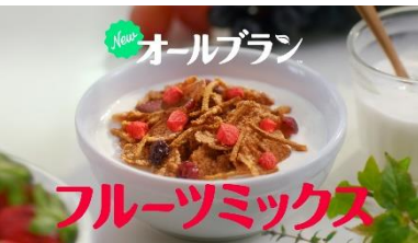
安達: ニューオールブラン!