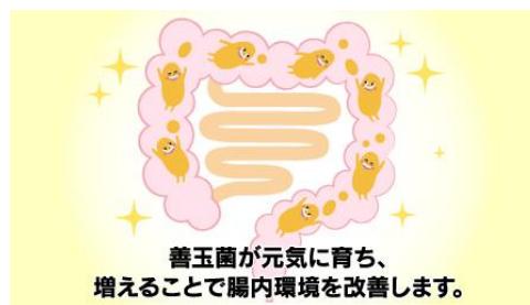
善玉菌のエサとなる「オールブラン」の発酵性食物繊維（アラビノキシラン）