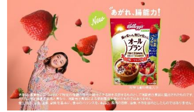
安達: オールブラン フルーツミックス