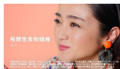
NA: 発酵性食物繊維が 腸内環境を改善。