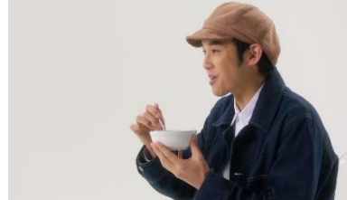
大学生: 止まらないっす笑