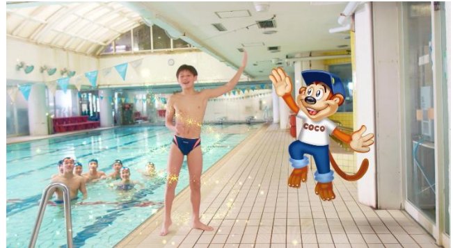
チョコ de マジック篇