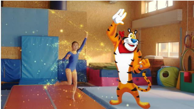
ミルク de マジック篇