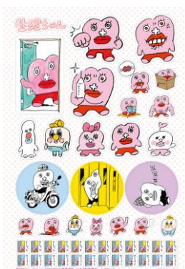
特別付録「生理ちゃんステッカー」