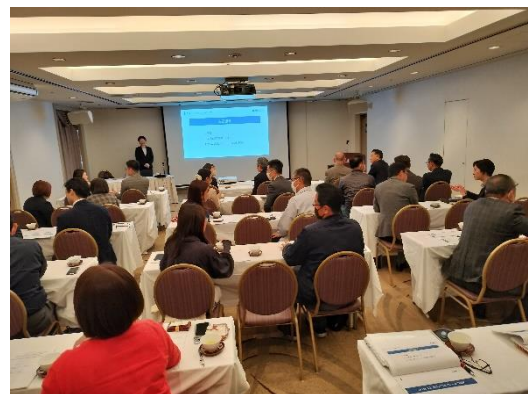
隣同士でディスカッションを行う参加者の様子

研修では、具体的なカスハラ事例を挙げながら「カスハラとクレームの違い」を学び、企業として求められるルールや体制整備の必要性、毅然とした対応を行うための心構えをお伝えしました。また、グループワークを通じて、他社・他業種の現状や対応例を共有し、実践的な学びを深めていただきました。