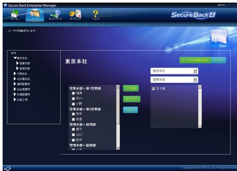
Secure Back Enterprise Manager インターフェース

「Secure Back 4」では、バックアップを管理するサーバ群の上位に「Secure Back Enterprise Manager」というマネジメント専用のコンソールを提供し、各管理サーバの操作を一元的に効率良く実行できるようにしたほか、人事異動を想定したサーバ間のユーザ移動や各サーバのステータス管理を可能にいたしました。