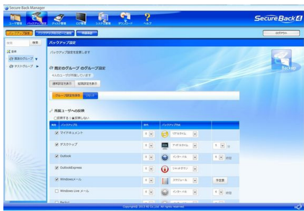
Secure Back Manager インターフェース

「Secure Back 3」ではお客様から「わかりやすい」「使いやすい」とご評価いただいておりますが、「Secure Back 4」では、従来のメニューを整理統合するなど、より直感的にお使いいただけるよう様々な工夫がなされています。