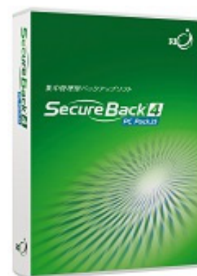
Secure Back 4 PC Pack