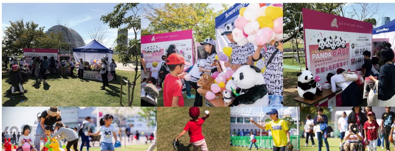
昨年の実施風景（2018年10月）

アドベンチャーワールド（和歌山県白浜町）は、2019年10月5日（土）一般社団法人志友会主催のキャッチボールイベント「TOKYO CATCH BALL CLUB 2019」にブース出展いたします。