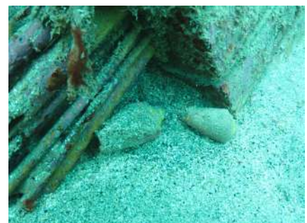
集まる巻貝のマガキガイ