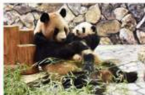
新たな出会いと感動の空間 パンダファミリーに感動の大接近