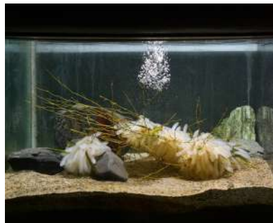
京都大学白浜水族館での展示