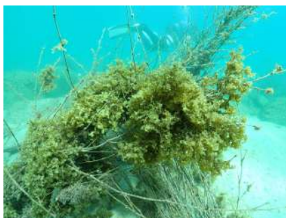
竹に着生した褐藻類のシワヤハズ