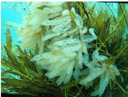
竹に産み付けられたアオリイカの卵塊