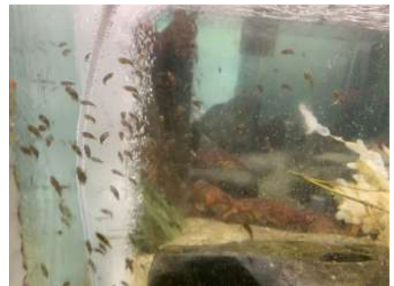
水槽内で孵化した稚イカたち