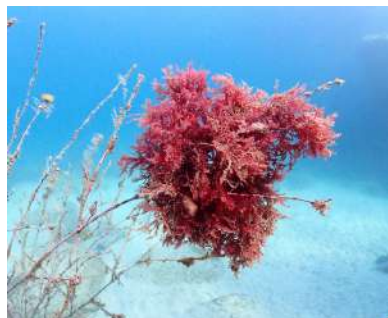
紅藻類のタマイタダキ