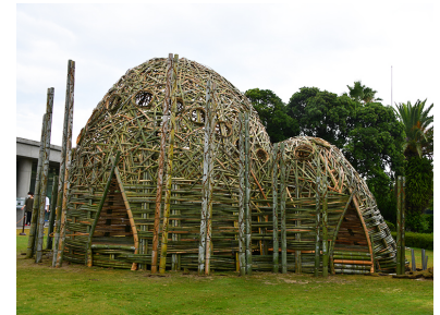
2023年作品「Love of “彩浜”」