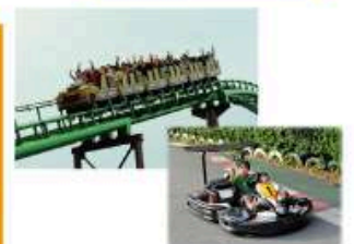
型にこだわらない遊びがまっている