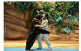
遠い昔から一緒だった 海からのやさしい贈り物に会う