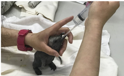
2019年7月16日撮影 人の手でエサを与えている様子

アドベンチャーワールド（和歌山県白浜町）において、2019年7月14日（日）キングペンギンの赤ちゃん（1羽、性別不明）が誕生しました。当パークでは、親鳥の重みで赤ちゃんが潰されてしまわないよう、保育器で体重が卵と同じ重さ（約300g）になるまで人の手で育て、体力をつけてから親鳥の元へ返す「初期人工育雛」という形で親鳥をサポートします。現在はスタッフが親代わりとなりニシン、オキアミ、生クリームを流動状にし与えており、ペンギン王国1階でご覧いただけます。