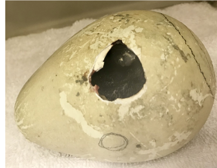
自力で卵の殻を割って出てくる様子 2019年7月12日撮影

アドベンチャーワールド（和歌山県白浜町）において、2019年7月14日（日）キングペンギンの赤ちゃん（1羽、性別不明）が誕生しました。当パークでは、親鳥の重みで赤ちゃんが潰されてしまわないよう、保育器で体重が卵と同じ重さ（約300g）になるまで人の手で育て、体力をつけてから親鳥の元へ返す「初期人工育雛」という形で親鳥をサポートします。現在はスタッフが親代わりとなりニシン、オキアミ、生クリームを流動状にし与えており、ペンギン王国1階でご覧いただけます。