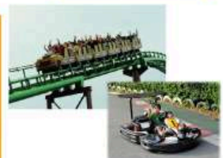
型にこだわらない遊びがまっている