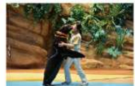
遠い昔から一緒だった 海からのやさしい贈り物に出会う