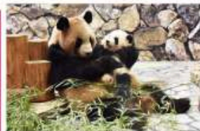
新たな出会いと感動の空間 パンダファミリーに感動の大接近